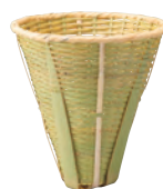
竹・ふりザル 持ち手なし(並)