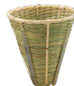
竹・ふりザル 持ち手なし